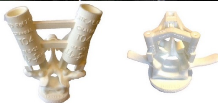
3D spine reconstruction Screw guides Osteotomy guide